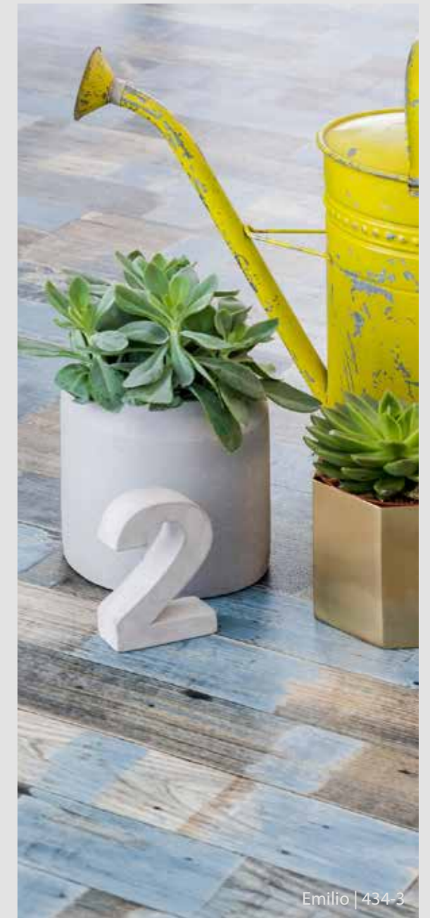
Emilio | 434-3