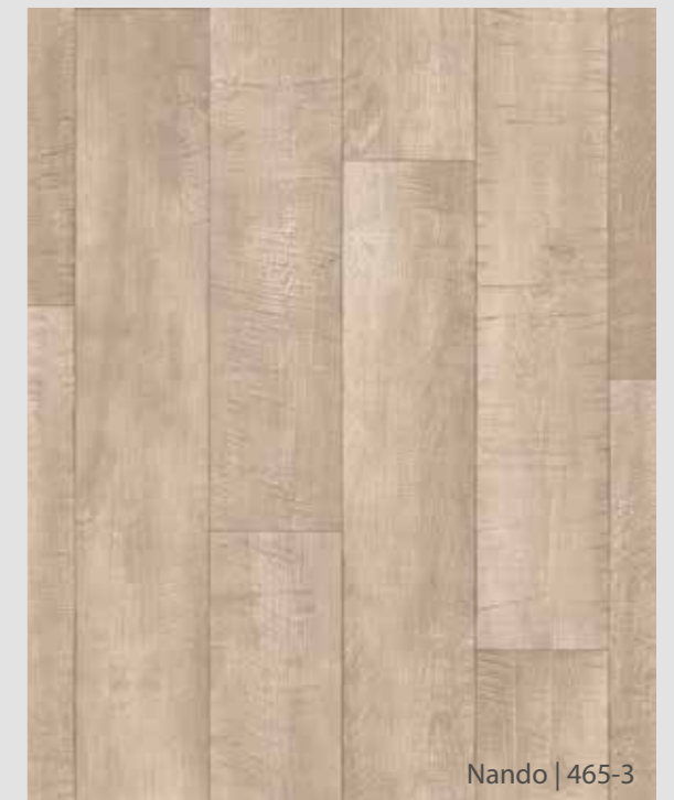
Nando | 465-3