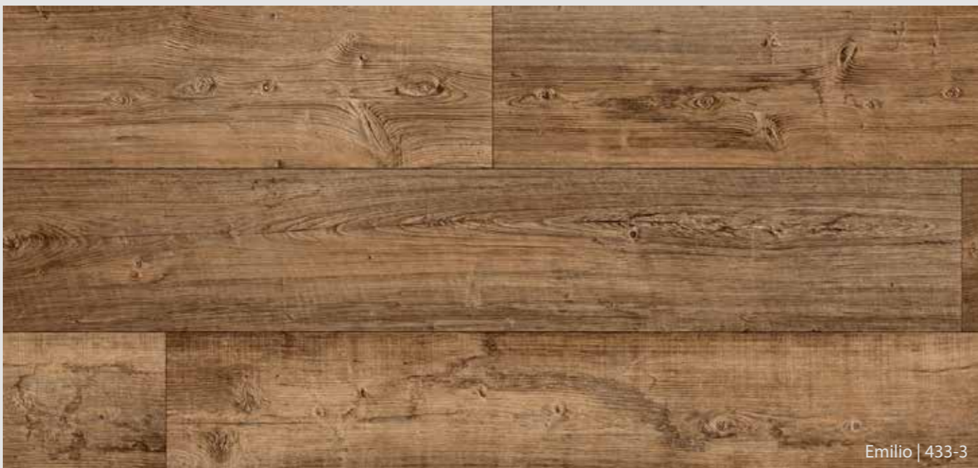
Emilio | 433-3