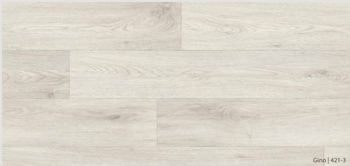
Gino | 421-3