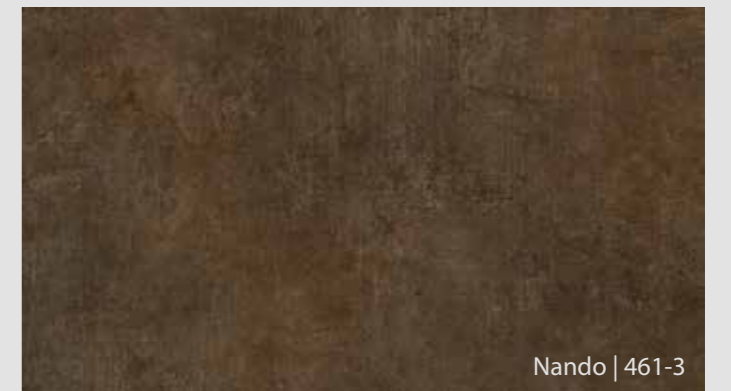
Nando | 461-3