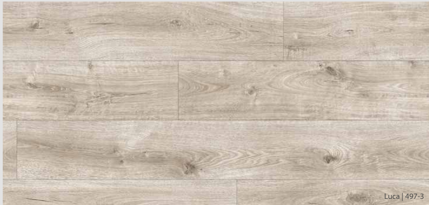
Luca | 497-3