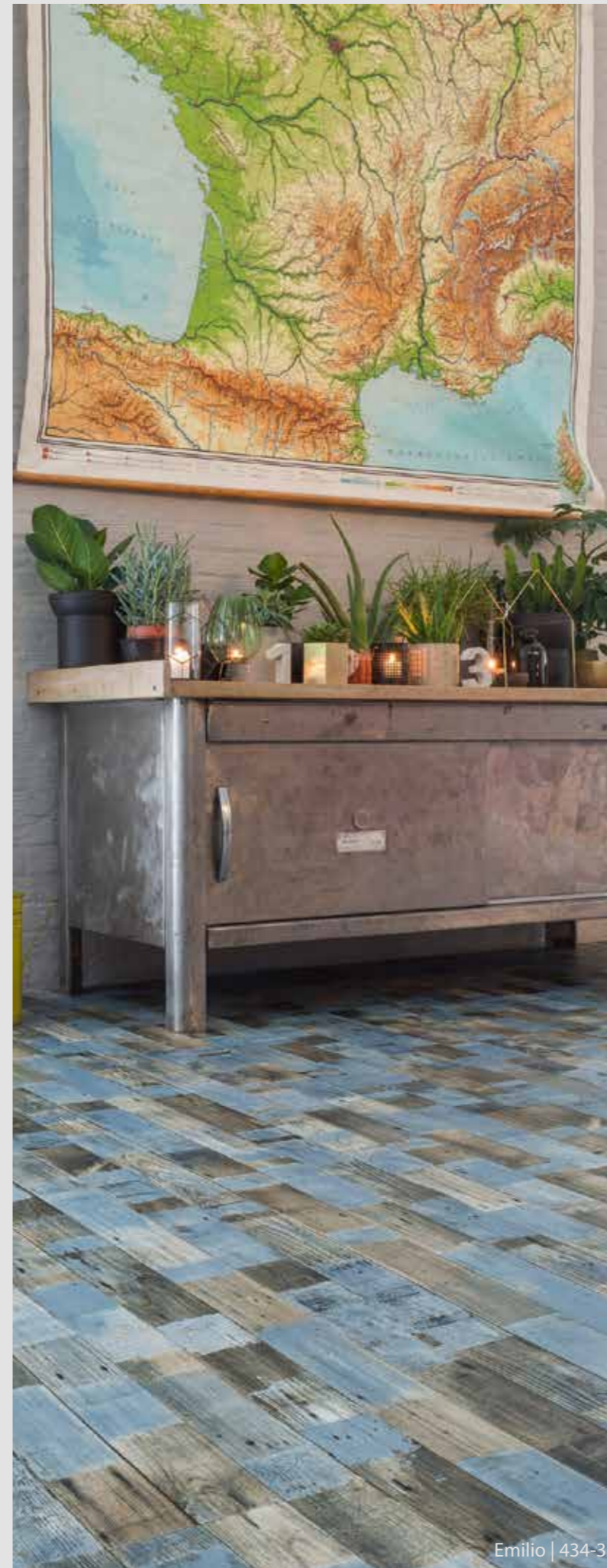
Emilio | 434-3