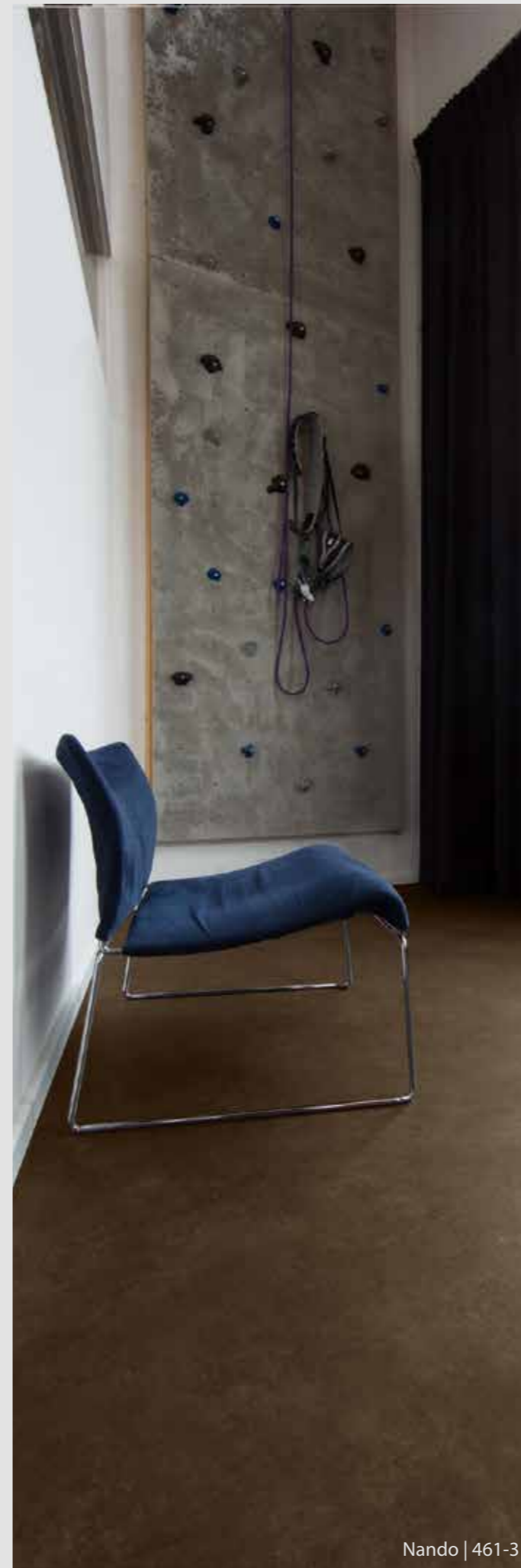
Nando | 461-3