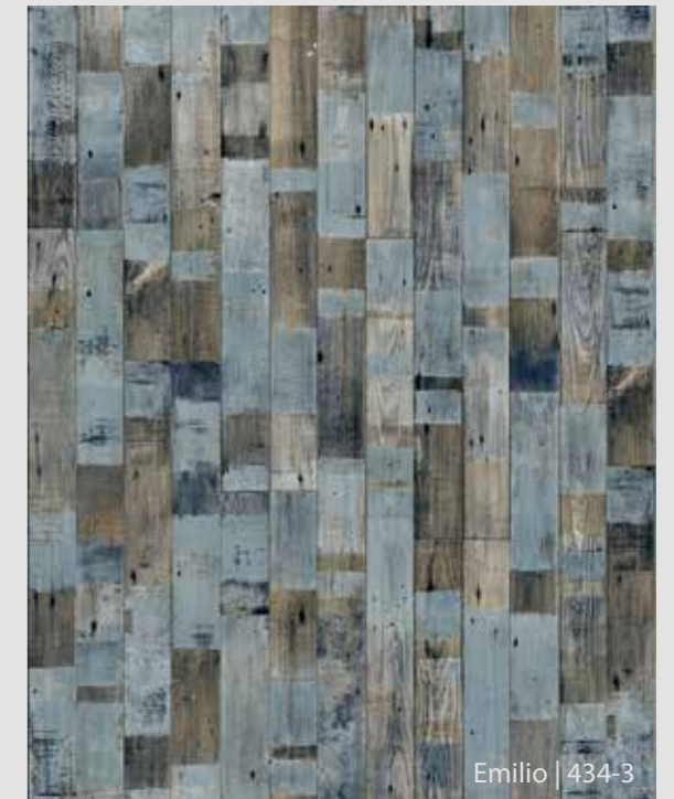
Emilio | 434-3