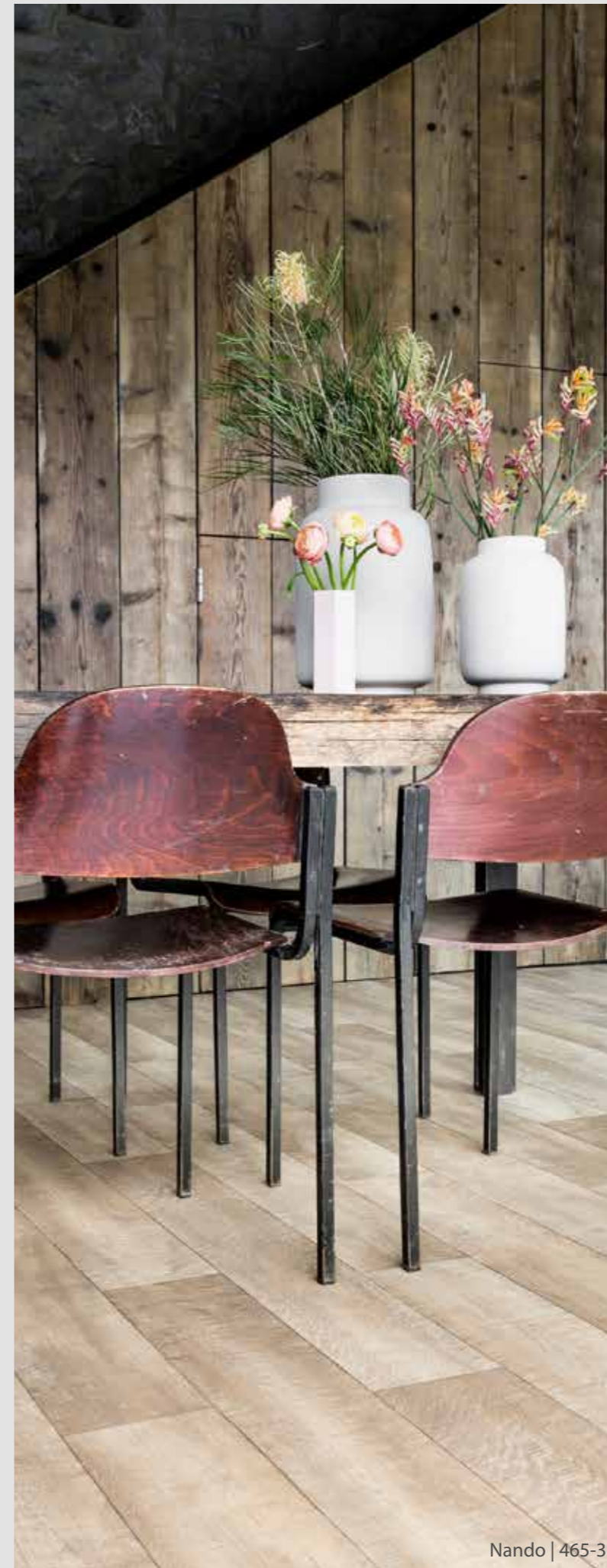
Nando | 465-3