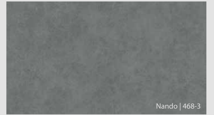
Nando | 468-3